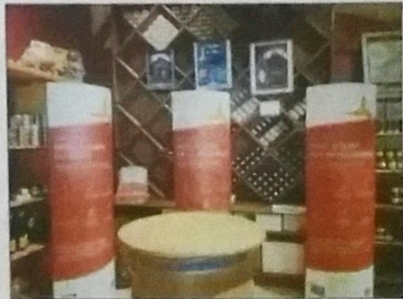
Projet éolien porté par la SODEL (Vin.Vent.Soleil).