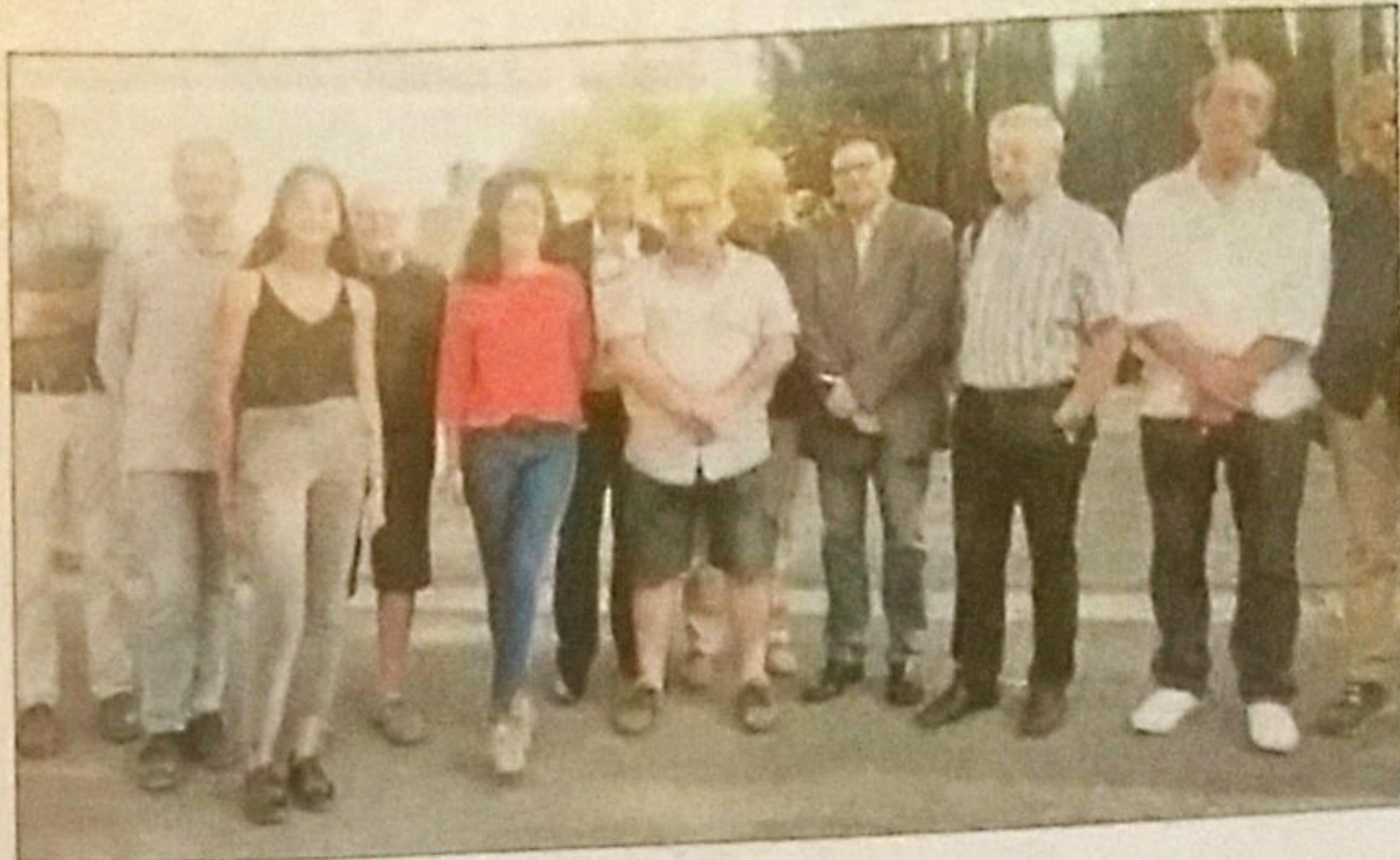
Vignerons, vingerons, élus réunis.

Ce projet coopératif, est marqué du sceau unique, car une vraie prise en main de leur destin pour les agriculteurs, afin de ne pas rester « en rade » dans un monde qui se transforme de plus en plus vite. Un projet « novateur » en énergie positive en Occitanie, identité, diversité, ru-